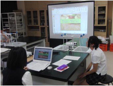
プロジェクト発表練習 (6月)