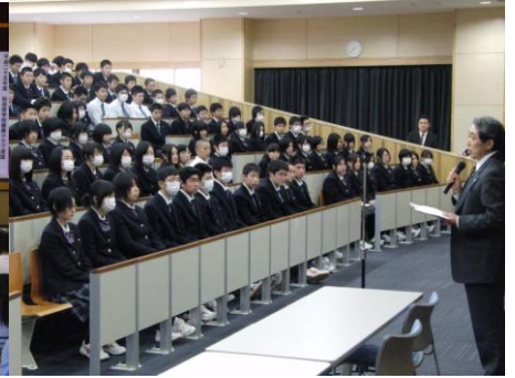
農業クラブ役員改選 (11月)