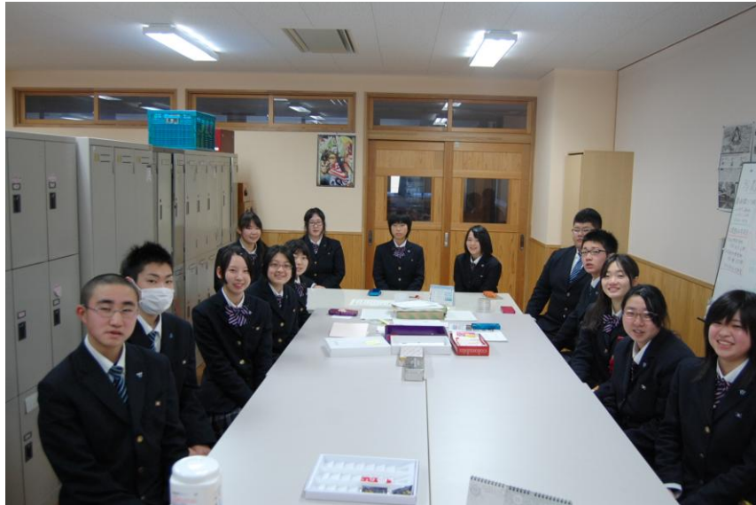
新執行部一同（2名欠です）

新執行部には、後輩たちがたくさん加わりました。私たちが経験してきた事を伝え、新しい事にどんどん挑戦していきたいと思います。まだまだ未熟者の私ですが、農ク役員の皆と協力して楽しく頑張っていきたいと思います。2014年もよろしくお願ひします。