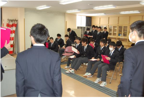
競技前の事前説明