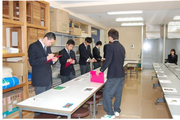
競技開始。共通問題ゾーンに挑戦