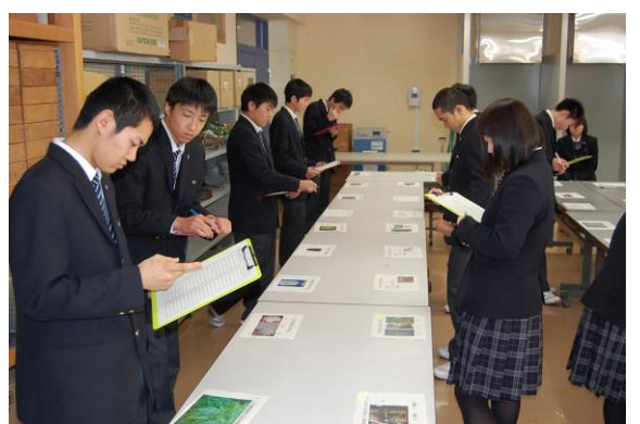
ここは、専門問題ゾーン。かなり苦戦しているようですね（T～T）