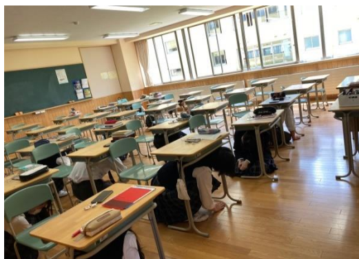
机の下にもぐり込む生徒たち

訓練は市内で最大震度6強の地震が発生したという想定で行いました。 ※シェイクアウト訓練とは、想定された日時(発災想定時刻)に、それぞれの場所で、自らの身を守る行動を一斉に行う訓練です。