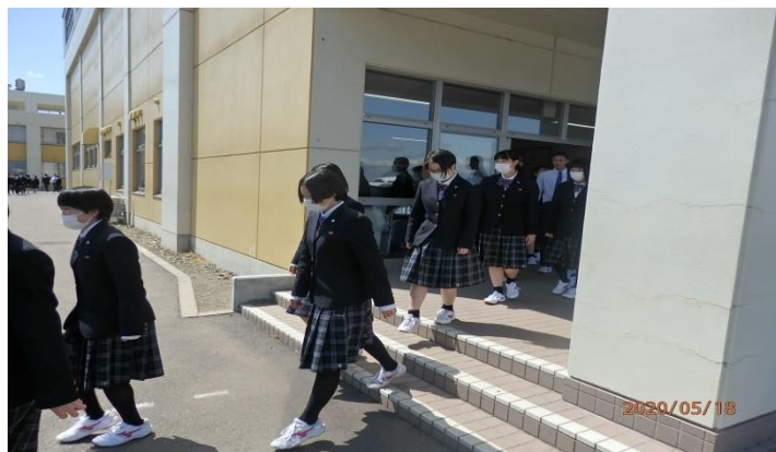
グラウンドに避難する生徒たち